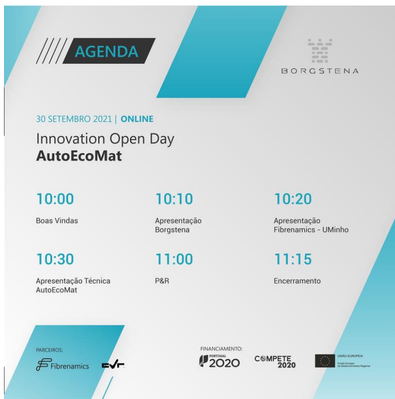
Figura 4. Agenda do Open Day.

No final do Open Day, foram recolhidas críticas positivas acerca dos resultados obtidos no presente projeto, tendo sido elogiada a visão demonstrada pelo consórcio para a obtenção dos mesmos. Neste sentido, ficou comprovado o carácter inovador dos desenvolvimentos levados a cabo, e a clara intenção de aprofundar e otimizar as soluções desenvolvidas nesta área, com a vista a poderem ser industrializadas e lançadas no mercado.