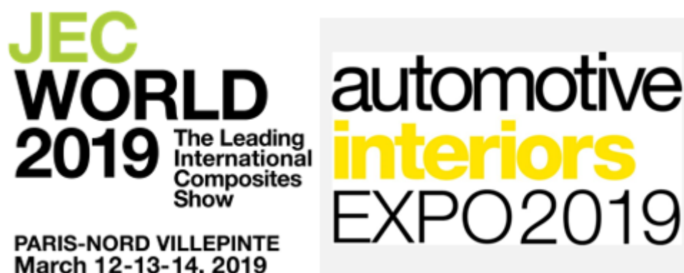
Figura 7. Participação em feiras e workshops no âmbito do projeto AutoEcoMat.

Relativamente à participação em feiras da especialidade e workshops relacionados com os tópicos de desenvolvimento do presente projeto, os vários elementos do consórcio tiveram a oportunidade de participar apenas nos eventos apresentados na Figura 7, dado o adiamento ou cancelamento dos eventos desta espécie, durante a fase pandémica.