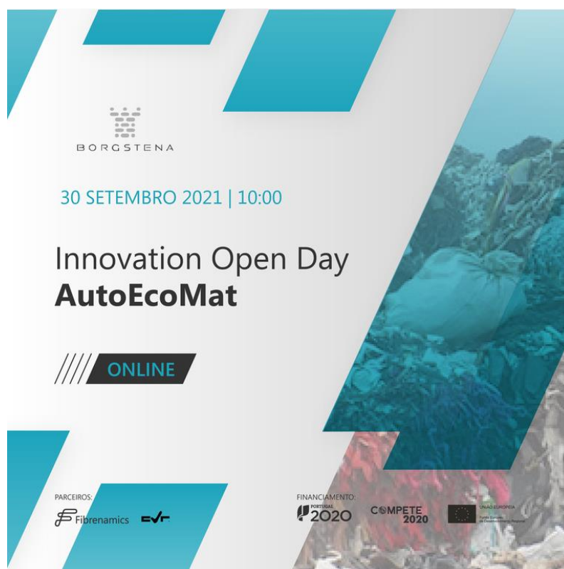
Figura 3. Header de apresentação do Open Day.

Na Figura 3 é apresentado um dos headers utilizados para promover o Open Day.