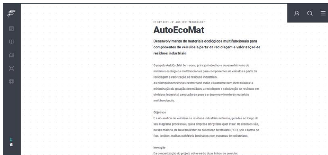
Figura 5. Divulgação do projeto AutoEcoMat no website da Fibrenamics.

No que diz respeito à dinamização dos websites das entidades envolvidas no consórcio, foi realizada, no âmbito do presente projeto, a divulgação do projeto através do website da Fibrenamics, como é evidenciado na Figura 5.